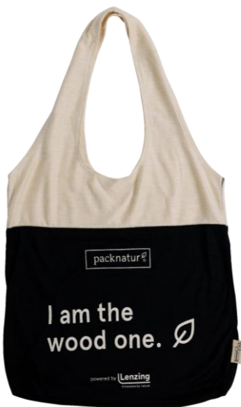
SMALL 35x31 cm 26 cm Henkel bedruckt