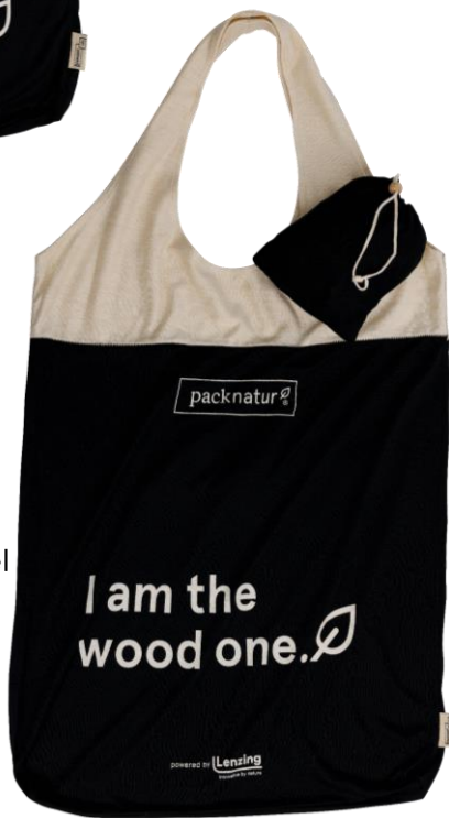
LARGE 50x68 cm 26 cm Henkel