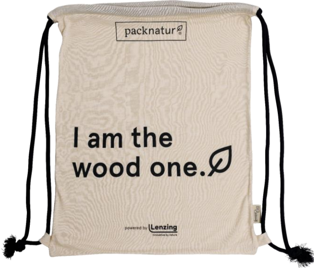
STANDARD 35x45 cm dicke schwarze Kordeln bedruckt