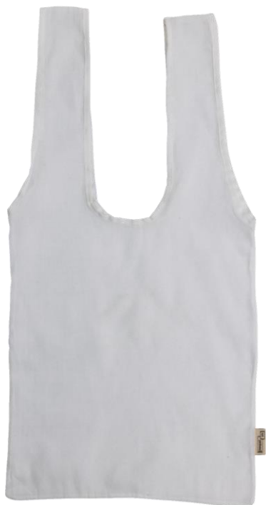
STANDARD 30x36 cm 26 cm Henkel