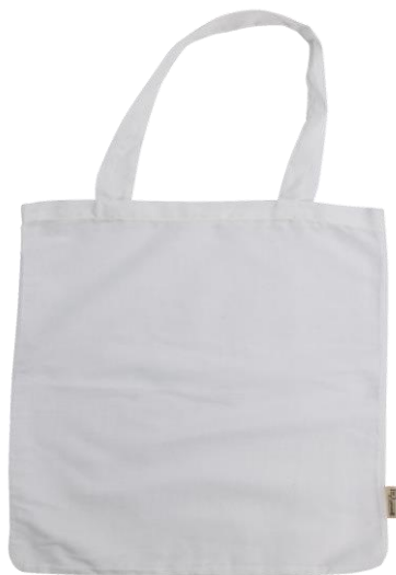
SQUARE 39x39 cm 26 cm Henkel transparent weiß