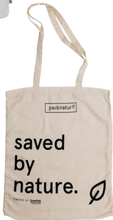
CLASSIC 35x42 cm 34 cm Henkel natur, bedruckt